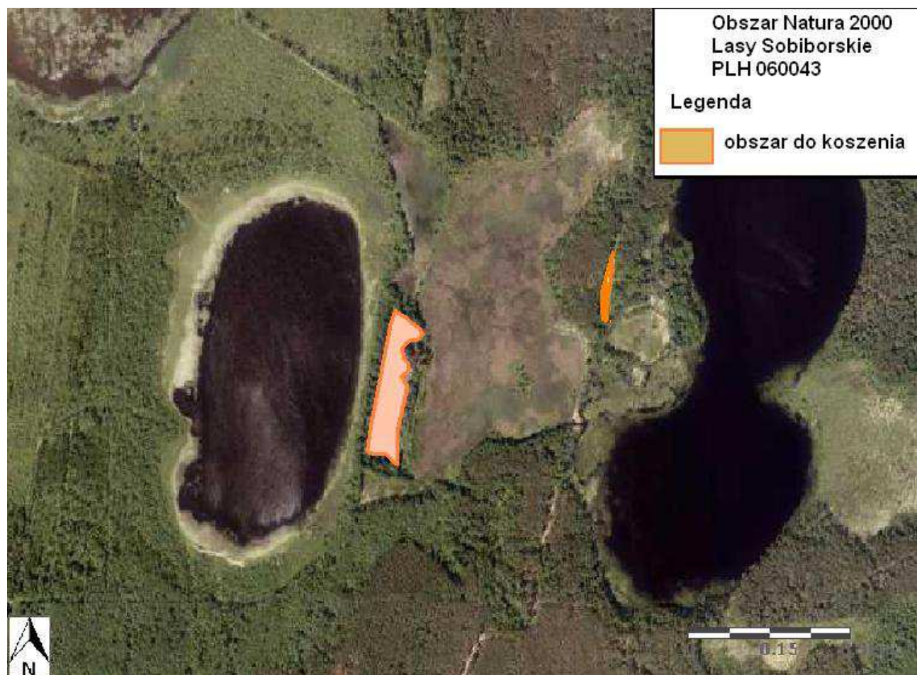
Mapa nr 1. Lokalizacja prac na łąkowisku żółwia błotnego w rezerwacie przyrody Żółtowie Błota.