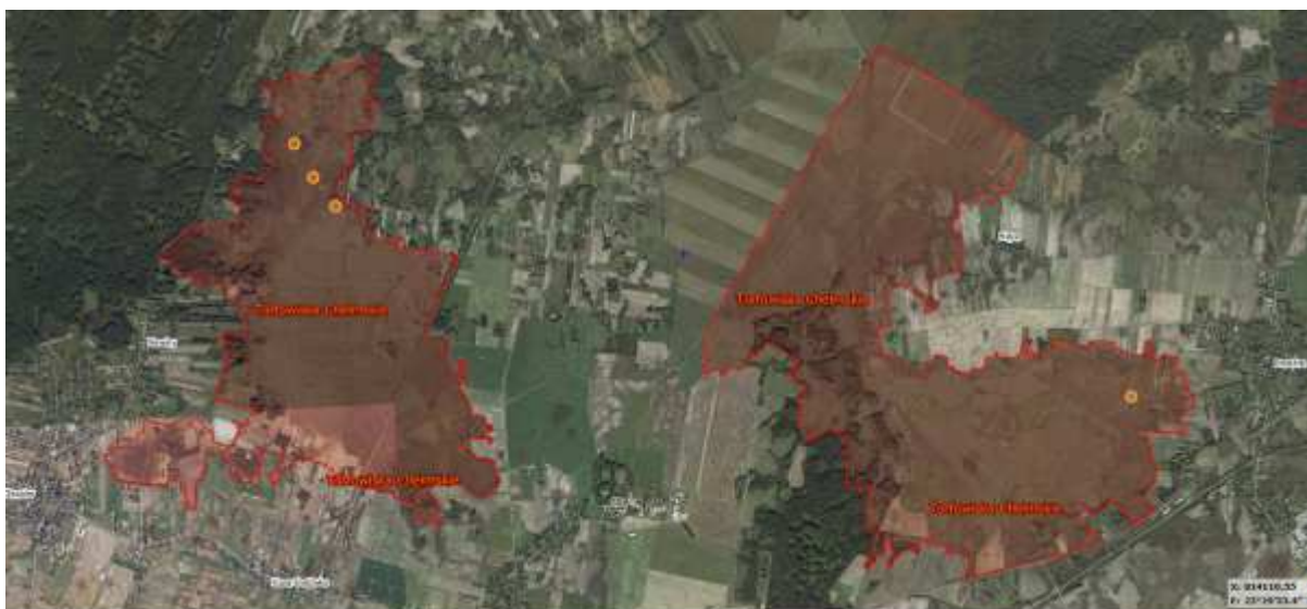
Mapa nr 1. Powierzchnie w obszarze Natura 2000 Torfowiska Chełmskie

Pomarańczowym kółkiem wskazano lokalizację powierzchni.