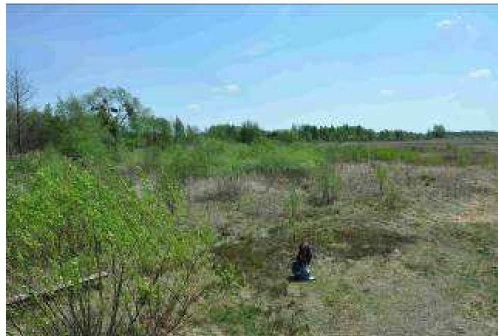
Powierzchnia nr 1 działka 665 obr. Srebrzyszcze