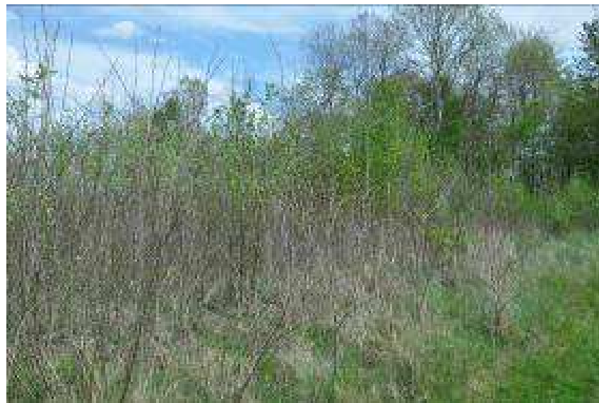
Powierzchnia nr 3 działka 665 obr. Srebrzyszcze