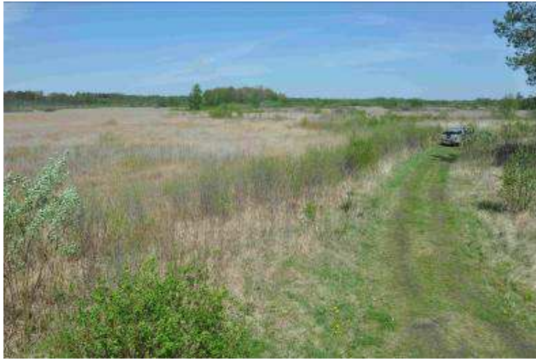
Powierzchnia nr 2 działka 665 obr. Srebrzyszcze