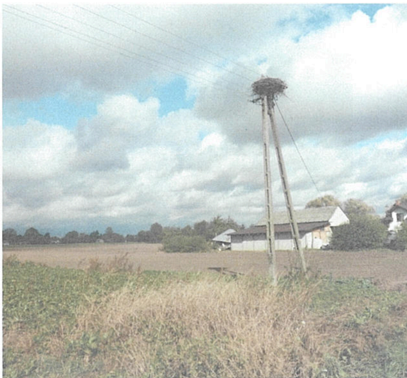
6. Teren w miejscowości Prehoryłe, gdzie ma być zamontowany nowy słup