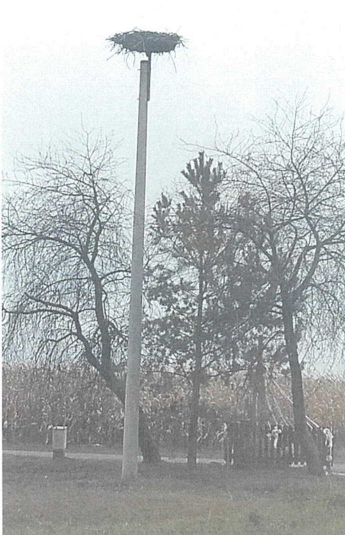
3. Gniazdo przeznaczone do rewitalizacji w miejscowości Gródek