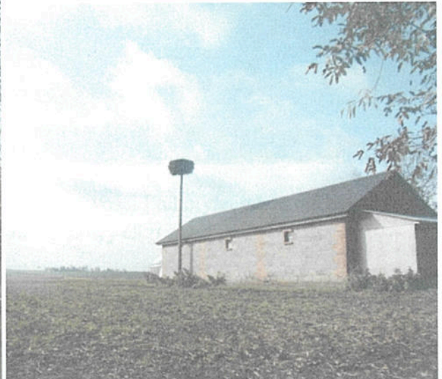
4. Gniazdo przeznaczone do rewitalizacji w miejscowości Stefankowice