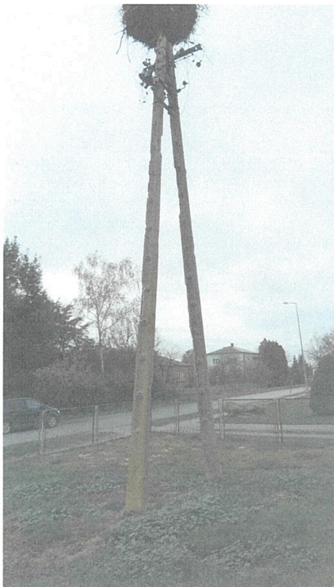
1. Gniazdo przeznaczone do rewitalizacji w miejscowości Barchaczów