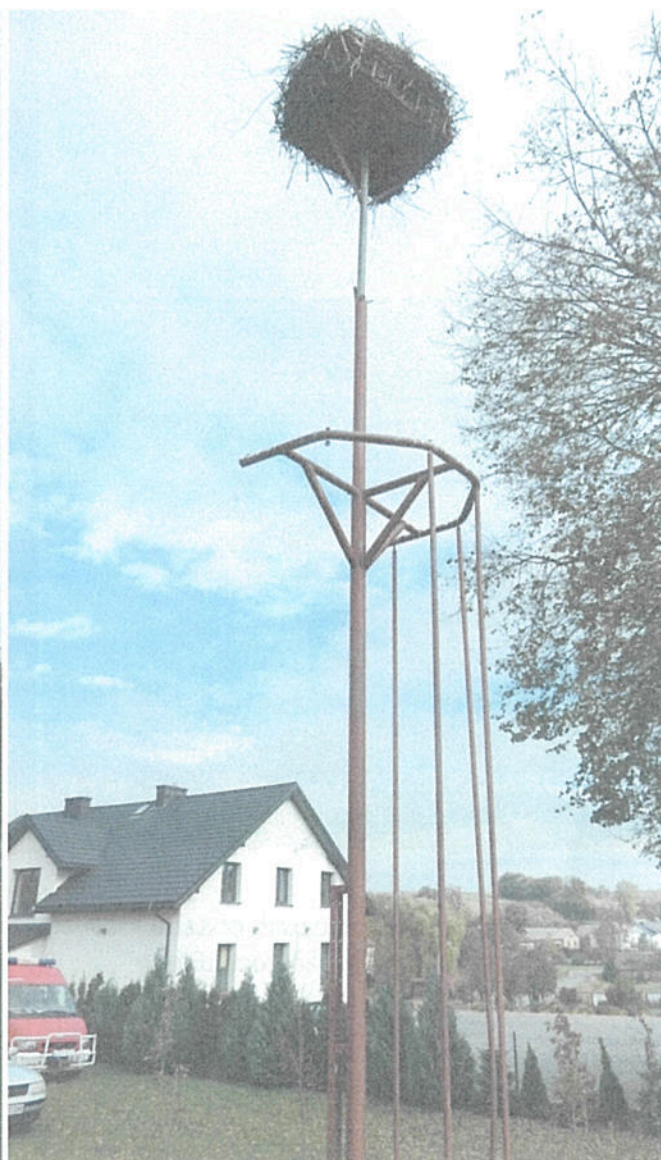
2. Gniazdo przeznaczone do rewitalizacji w miejscowości Majdan Ruszowski