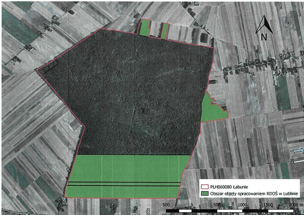
Lokalizacja powierzchni obszaru PLH060080 Łabunie objętych opracowaniem przez RDOŚ w Lublinie

Problemem dla ochrony przyrody w obszarze Natura 2000 jest duże rozdrobnienie i niewielka powierzchnia działek leśnych należących do poszczególnych właścicieli. Dużym zagrożeniem dla zachowania wartości przyrodniczych obszaru jest zarastanie. Wzrost zacienienia spowodowany sukcesją roślinności zagraża populacji chronionego obuwika. Kluczowe dla ochrony tego gatunku jest zapewnienie odpowiednich warunków świetlnych w runie. Dla zachowania grądu subkontynentalnego na terenie lasów gospodarczych ważnym czynnikiem jest prowadzenie gospodarki zgodnej z wymogami ochrony tego siedliska. Inne informacje o obszarze dostępne są na stronie internetowej: www.natura2000.gdos.gov.pl .