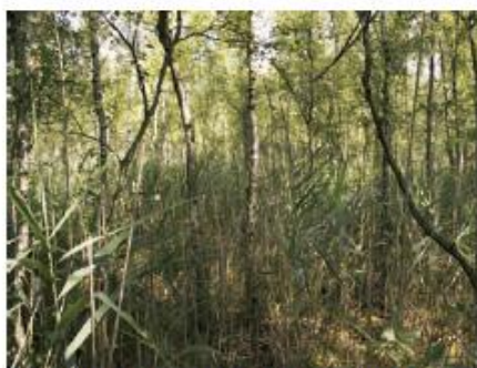
Fot. 8. Trudny do zaklasyfikowania brzozowy las bagienny w Borach Dolnośląskich