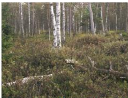
Fot. 2. Brzezina bagienna na Pomorzu

Bory i lasy bagienne są często składnikiem bardziej złożonej i dynamicznej mozaiki ekosystemów torfowiskowych. W wielu miejscach są one fazą sukcesji na pierwotnie bezleśnych torfowiskach. Planowanie ochrony musi uwzględniać ten fakt – z jednej strony niekiedy ochrona bezleśnego torfowiska będzie miała priorytet nad ochroną boru bagiennego, z drugiej strony ochrona boru bagiennego w wielu przypadkach powinna akceptować zachodzące w nim zmiany sukcesyjne mające charakter „dojrzewania” fitocenozy.