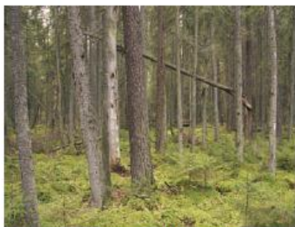
Fot. 6. Borealna świerczyna na torfie w Polsce północno-wschodniej

Grubość warstwy torfu może być zróżnicowana, od kilkunastu centymetrów do kilkunastu metrów. Zwykle są to torfy mszarne, mszyste i turzycowe, o wysokim lub przejściowym charakterze. Żyzność siedliska jest umiarkowana i odpowiada oligo- lub mezotrofii. Zasilająca siedlisko woda jest zwykle kwaśna i uboga w substancje odżywcze, choć znane