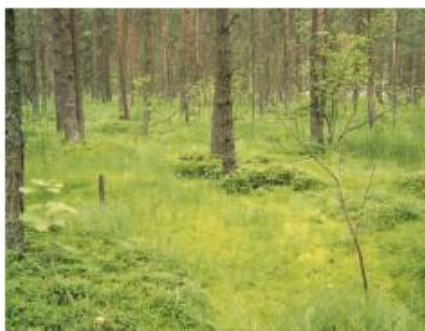
Fot. 3. Bór bagienny na Torfowiskach Orawsko-Nowotarskich