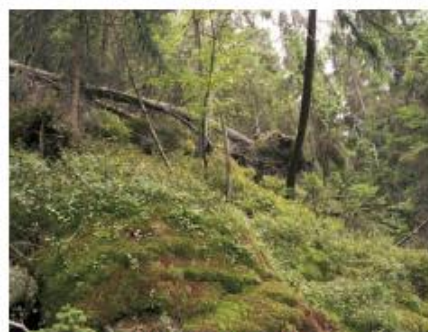
Fot. 9. „Zboczowy” górski bór bagienny na wsiążkach kwaśnych wód podziemnych. Góry Kamienne.