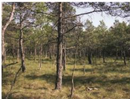
Fot. 4. Płat o charakterze przejściowym między borem bagiennym a otwartym torfowiskiem