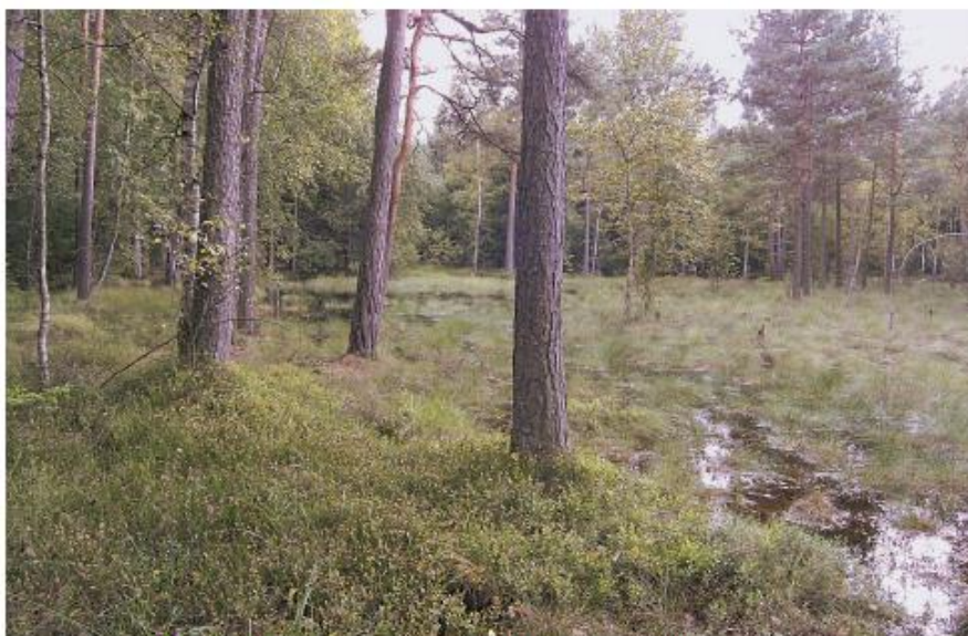
Fot. 1. Sosnowy bór bagienny w północno-wschodniej Polsce