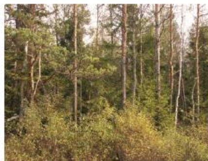
Fot. 7. Borealny bagienny las sosnowo-brzozowy