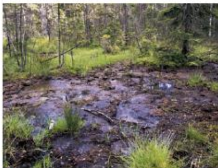
Fot. 5. Górski bór bagienny w Górach Bystrzyckich